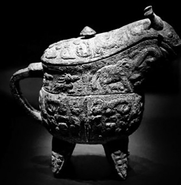
河南安阳殷墟博物馆新馆内展出的「司母辛」铜鼎(左上)、「亚长」铜钺(右上)、「亚长」牛尊(左下)、「亚长」铜钺(右下)。

沿着习近平总书记指引的方向,安阳从千年文脉延绵中感知来路,在革命精神中砥砺奋进,在高质量发展中阔步前行。