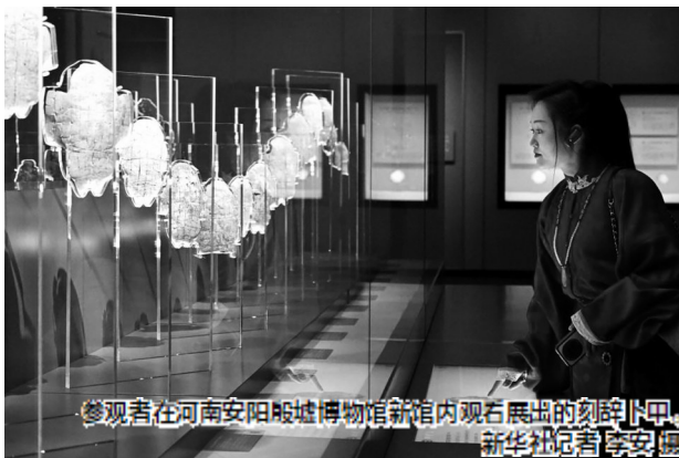
参观者在河南安阳殷墟博物馆新馆内观石展出的刻辞卜甲。