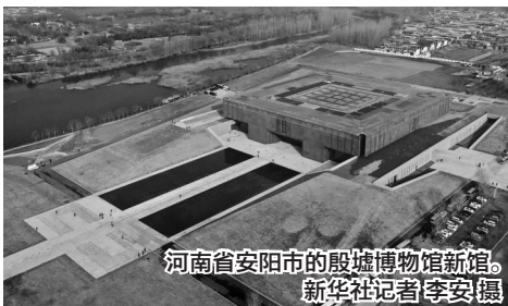
河南省安阳市的殷墟博物馆新馆。

如今,安阳正以坚定的文化自信,着力打造中华文化新地标、中原文旅新名片,形成富有特色的城市文化新格局。