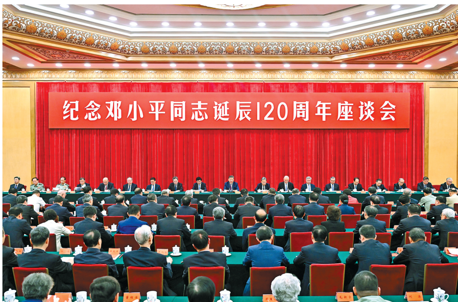
8月22日,中共中央在北京人民大会堂举行纪念邓小平同志诞辰120周年座谈会。习近平、赵乐际、王沪宁、蔡奇、丁薛祥、李希、韩正等出席座谈会。

新华社北京8月22日电 中共中央22日上午在人民大会堂举行座谈会,纪念邓小平同志诞辰120周年。中共中央总书记、国家主席、中央军委主席习近平发表重要讲话。他强调,邓小平同志是全党全军全国各族人民公认的享有崇高威望的卓越领导人,伟大的马克思主义者,伟大的无产阶级革命家、政治家、军事家、外交家,久经考验的共产主义战士,党的第二代中央领导集体的核心,中国改革开放和现代化建设的总设计师,中国特色社会主义道路的开创者,邓小平理论的主要创立者,为世界和平和发展作出重大贡献的伟大国际主义者。他对党、对人民、对国家、对民族、对世界作出了突出贡献,功勋彪炳史册、永励后人。