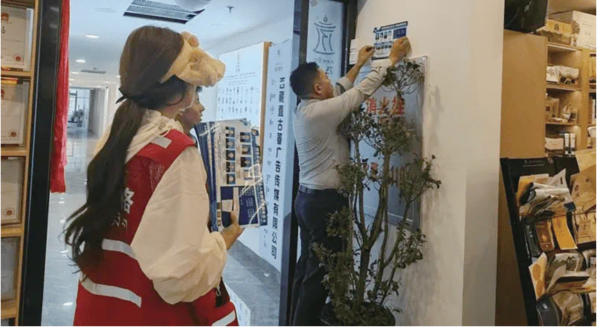
工作人员张贴便民联系卡。