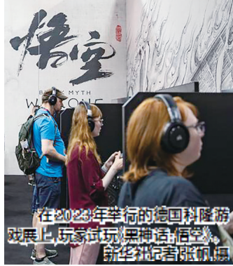
在2023年举行的德国科隆游戏展上,玩家在玩《黑神话:悟空》,不少玩家直呼过瘾。

放眼全球,画面的绝对品质更是吸引海外受众的基础。冯骥举了个形象的例子:把中国故事讲给外国受