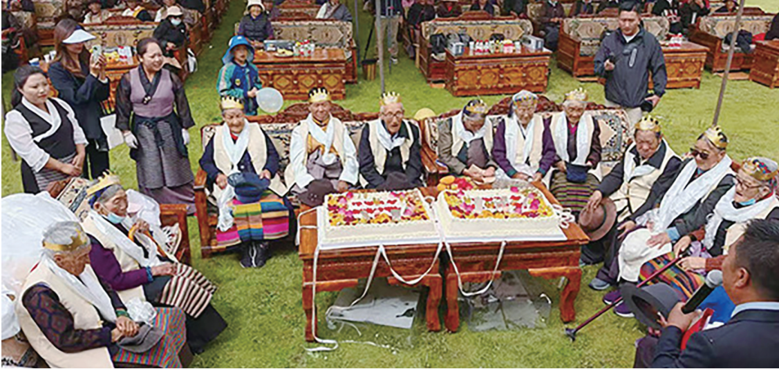
“长寿宴”活动现场。