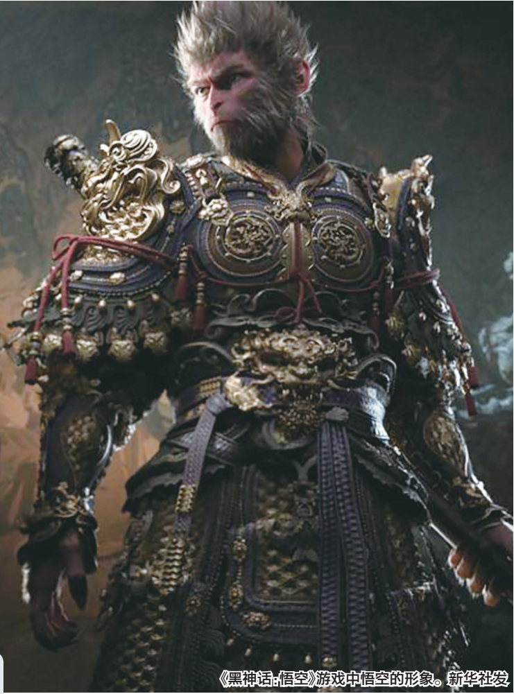
《黑神话:悟空》游戏中悟空的形象。新华社发