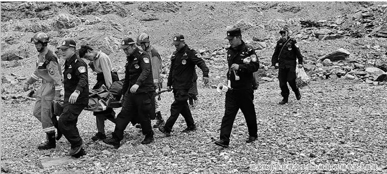
游客独自登琼穆岗嘎雪山被困,民辅警紧急救援。