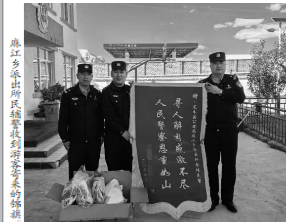
麻江乡派出所民辅警收到游客寄来的锦旗。

登山作为一项耗氧量较大、比较剧烈的运动方式,自然环境的恶劣、个人操作上的失误,都会造成意外。在登山时,要结伴同行,前往旅游开发完善、基本安全有保障的地区。如果迷路,应折回原路,或寻找避难场所静待救援。天气条件是影响户外登山活动的重要因素,高海拔地区可能出现降雪,会增加登山中滑倒甚至掉落摔伤的风险。出行前,应及时关注行程沿线及目的地气象部门发布的天气预报,特别是临近预报预警信息,合理安排行程,避免在恶劣天气下外出或进行户外活动。出行要避开山区、河谷等易发生山洪、泥石流的地段。前往西藏各地游玩,需注意昼夜温差大、高原反应等情况。