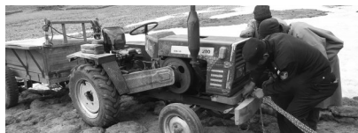
在当雄县洛堆峰,民辅警采取徒手推、拖拉机拉的方式一点一点将被困车辆拉向公路。