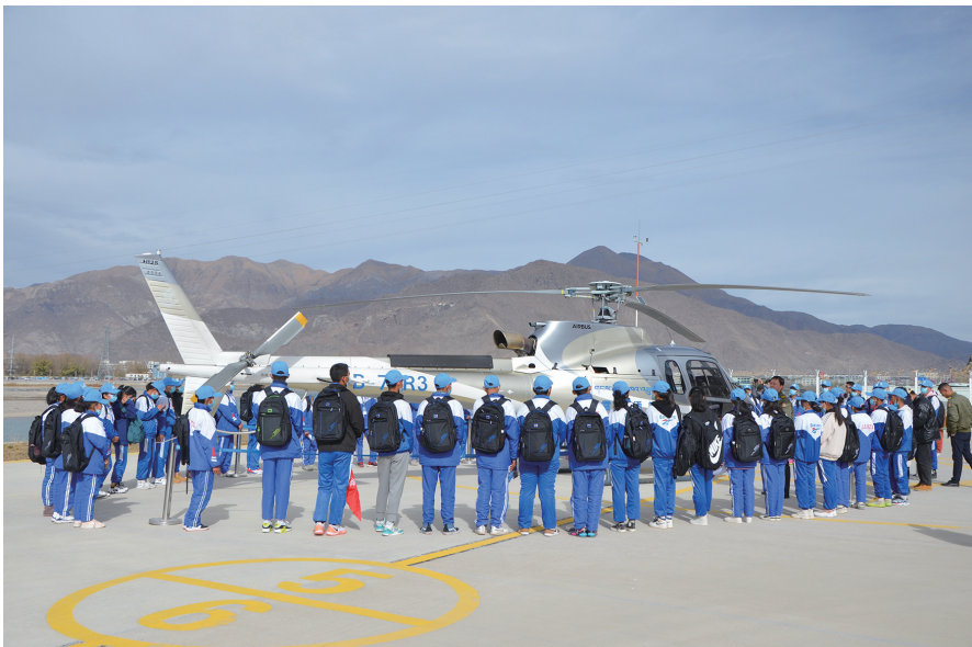
拉萨市中学生开展“游学幸福新拉萨 共筑美丽中国梦”主题研学实践教育活动,参观高原直升机。