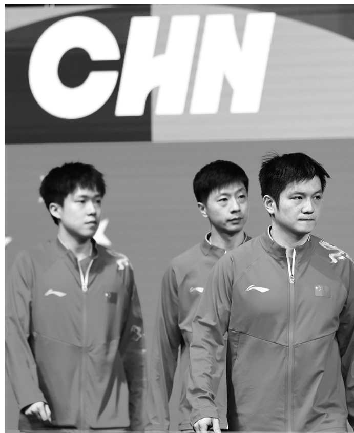
8月6日,中国选手在赛前出场。