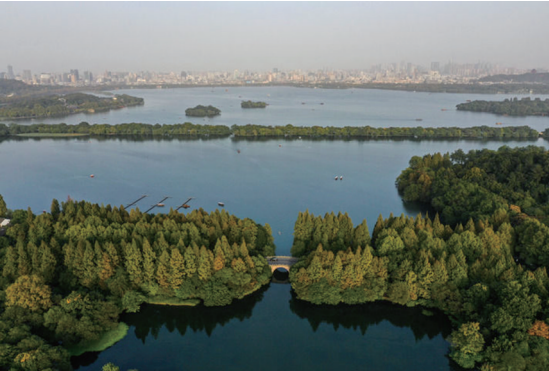
杭州西湖景区杨公堤附近的景色。