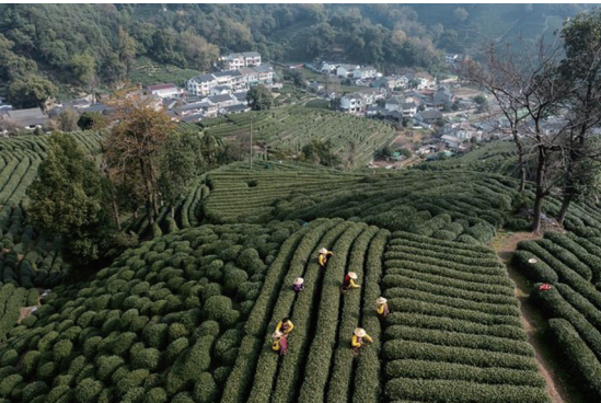
龙井村的茶农在采摘西湖龙井“明前茶”。