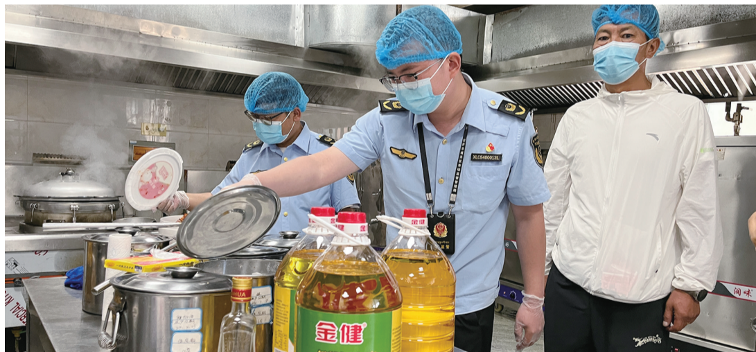
市场监管部门工作人员开展校园食品安全检查。