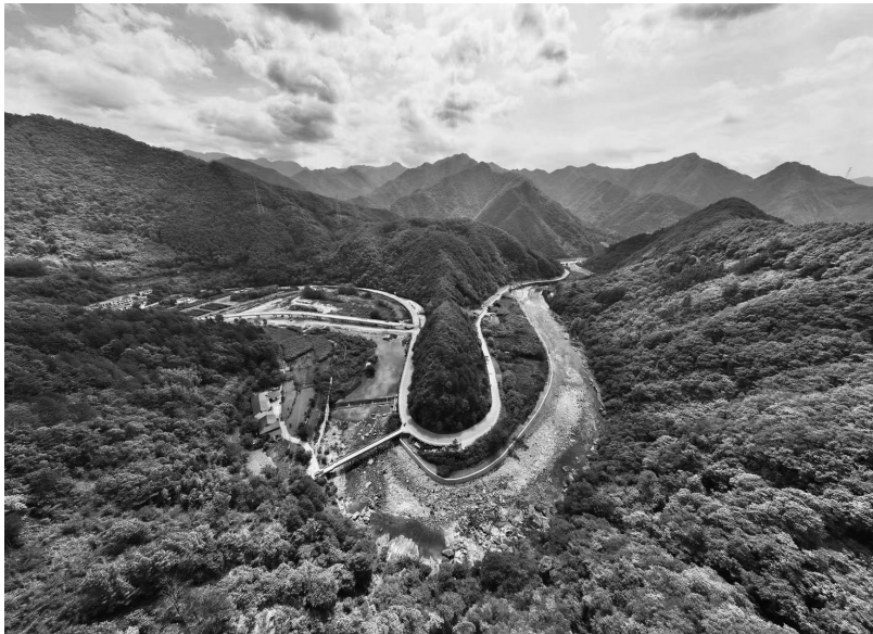
陕西省汉中市佛坪县的乡村公路。

6月中旬,“中国美丽休闲乡村”西藏自治区山南市琼结县拉玉乡强吉村的油菜进入盛花期。一到周末,驾车到此的