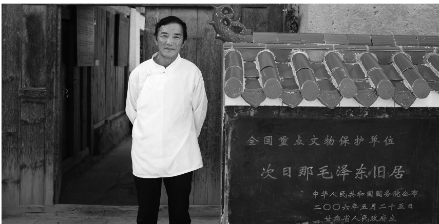
→桑洁站在次日那毛泽东旧居门前。