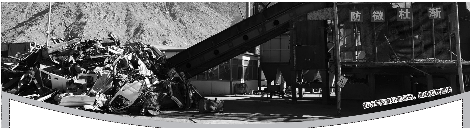
机动车报废处理现场。