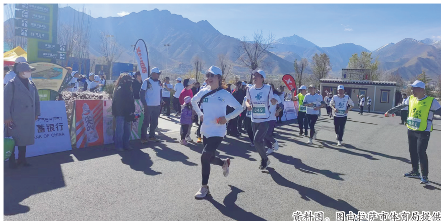
资料图。图由拉萨市体育局提供

跨越拉萨大桥、迎亲大桥到达布达拉宫的经典线路,让不少跑友体会了西藏独特的魅力。今年也一如既往地延续了以往的经典线路,分别为半程马拉松(21.0975公里):从西藏自治区会展中心出发(起点)—江苏大道—藏热路南段—藏热大桥—泵巴热公园—慈觉林大道—鹏鑫隧道—南环路—滨河体育公园—连心桥—滨河路口—滨河路—民族中路—民族北路—当热西路—德吉路北段—北京中路—布达拉宫广场(终点);竞速跑(10公里):西藏自治区会展中心(起点)—江苏大道—藏热路南段—藏热大桥—泵巴热公园—慈觉林大道—鹏鑫隧道—南环路—万达广场(终点);健康跑(5公里):西藏自治区会展中心(起点)—江苏大道—藏热路南段—藏热大桥—泵巴热公园(终点)。