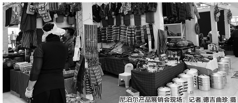
尼泊尔产品展销会现场。

本报讯(记者 德吉曲珍)不丹的服饰,尼泊尔的铜器工艺品、纯手工编织的卡垫……近日,拉萨市城关区嘎吉林广场举行的拉萨—尼泊尔特色手工艺品交易展会,吸引了众多市民前来逛展。