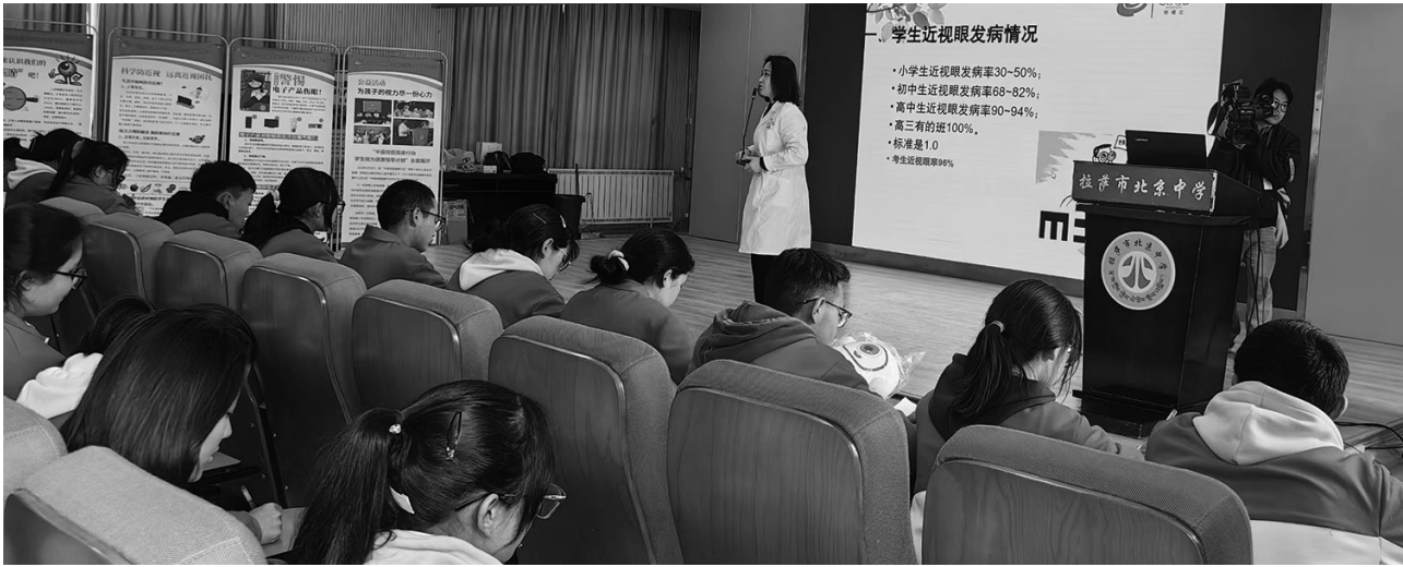
专家老师在拉萨市北京中学开展预防近视讲座活动。