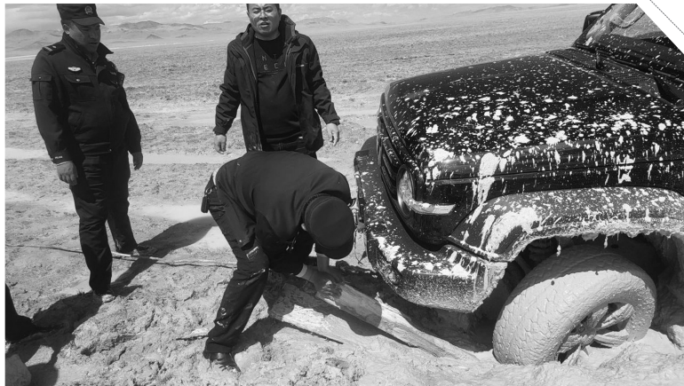
改则县公安局洞措乡派出所民警帮助被困车辆脱困。