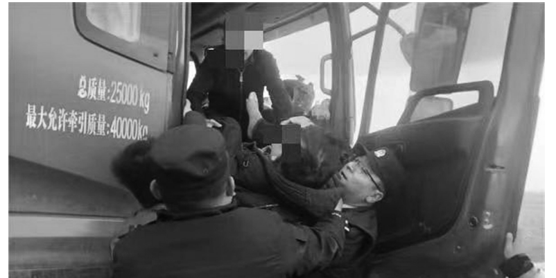
先遣乡派出所民警救助高反卡车司机。

民警提醒:在高温天气下,密闭的车辆加上暴晒等于炙热的“大烤箱”。不论出于任何理由,都不应将儿童单独留在车内,即使是开启空调或留下窗户缝隙都极为危险。