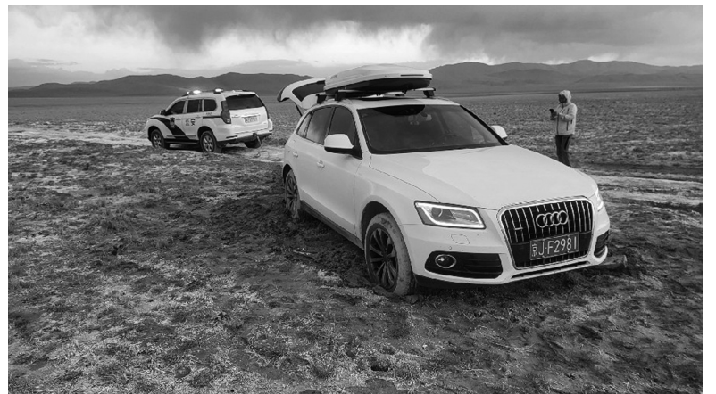
救援现场。

在过往司乘人员的协助下,救援团队及时将驾驶员转移至救护车。医护人员一边对卡车司机进行救治,一边将其送往改则县人民医院进一步治疗。由于救援及医疗团队的快速反应和专业处置,该名司机已转危为安。