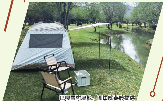
巴嘎雪村湿地。

金星游乐园 作为拉萨市第一家游乐园,1998年开园以来,已运营超过20年,一直深受儿童喜爱。位于拉萨市区内,现有20多个游乐项目。“六一”期间,游乐园推出充值100元送20元的优惠活动。