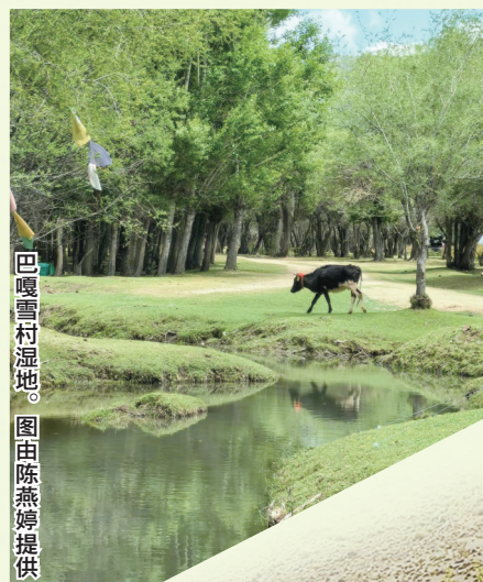
巴嘎雪村湿地。