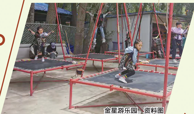
金星游乐园。资料图