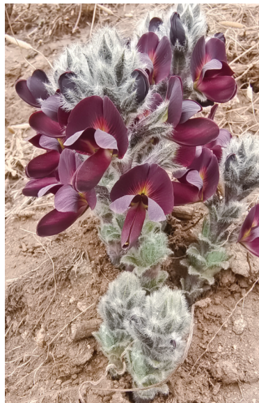
紫花野决明。