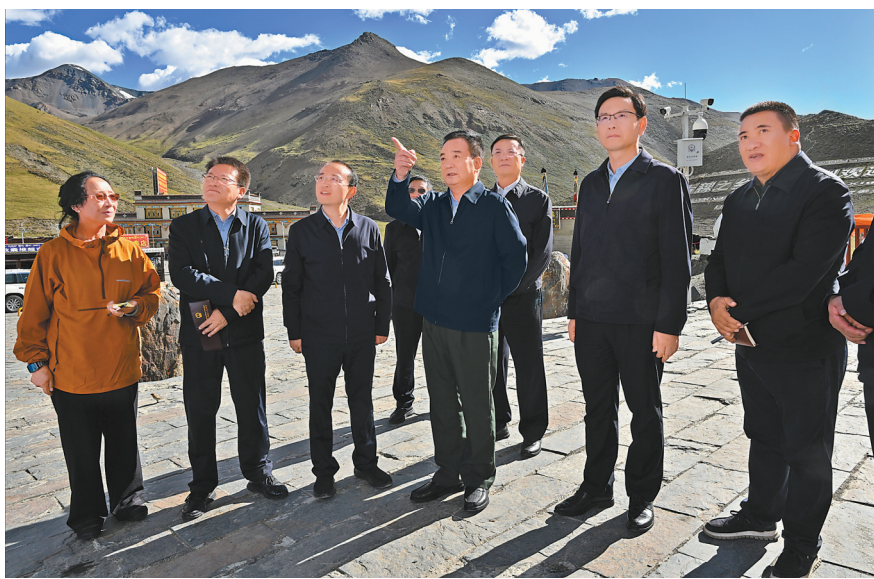
7月5日至7日，自治区党委书记王君正在日喀则市江孜县、白朗县、桑珠孜区调研。这是王君正在卡若拉冰川现场督导中央生态环境保护督察反馈问题整改工作。