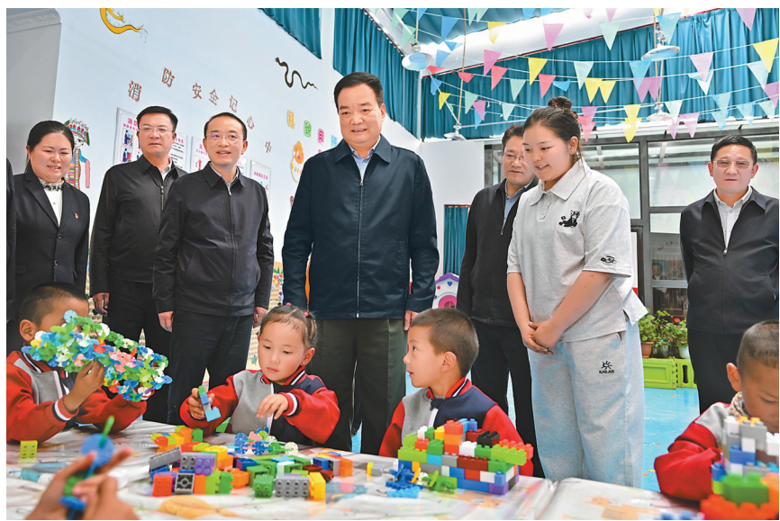
7月5日至7日，自治区党委书记王君正在日喀则市江孜县、白朗县、桑珠孜区调研。这是王君正在白朗县旺丹乡桑巴村幼儿园了解基层学前教育情况。

坚持以习近平新时代中国特色社会主义思想统揽工作全局 持之以恒抓好“四件大事”落实 为建设社会主义现代化新西藏作出更大贡献