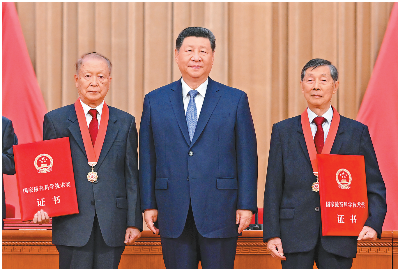
7月8日上午，国家科学技术奖励大会、中国科学院第二十二次院士大会和中国工程院第十八次院士大会、中国科学技术协会第十一次全国代表大会在北京人民大会堂隆重召开。中共中央总书记、国家主席、中央军委主席习近平向获得2025年度国家最高科学技术奖的中国科学院物理研究所陈立泉院士(右)和中国电子科技集团第十四研究所贲德院士(左)颁奖。

新华社北京7月8日电 国家科学技术奖励大会、中国科学院第二十二次院士大会和中国工程院第十八次院士大会、中国科学技术协会第十一次全国代表大会8日上午在人民大会堂隆重召开。中共中央总书记、国家主席、中央军委主席习近平出