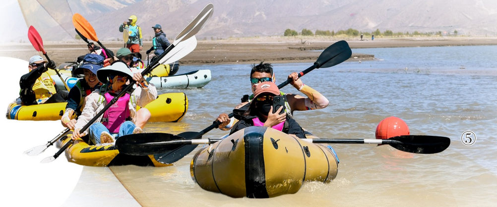
图①：扎囊县城鸟瞰图。 图②：扎囊县境内的雅鲁藏布江观景台。 图③：在沙丘地里建起来的生态绿洲——西藏绿之源现代农业科技股份有限公司蔬菜基地。 图④：扎囊县境内的拉萨至山南S5公路。 图⑤：在扎囊县桑耶镇举办的第二届2026中国“传奇”挑战赛（西藏·山南站）的皮划艇竞赛现场。

风劲潮涌千帆竞，砥砺奋进启新程。站在新的发展起点，扎囊县将始终坚持生态优先、绿色发展、产业富民的发展导向，在全面推进乡村振兴、推动县域经济提质增效的新征程上续写崭新篇章。