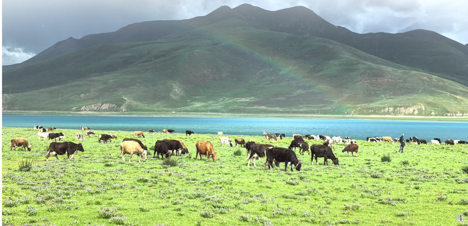
图①:浪卡子县城全景。(浪卡子县融媒体中心供图) 图②:羊卓雍错湖畔游人如织。周启斌摄 图③:浪卡子县农业农村局组织技术人员对良种进行测产。(浪卡子县农业农村局供图) 图④:在羊卓雍错湖边吃草的改良牛。(浪卡子县农业农村局供图) 图⑤:短期育肥中的苏格绵羊。(浪卡子县委宣传部供图)