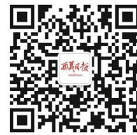
西藏日报 微信公众号