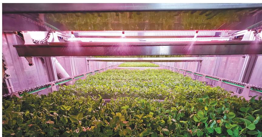
图为智能种植舱培育出的豌豆尖。