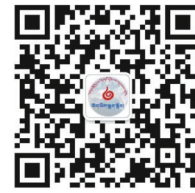
西藏日报 微信公众号