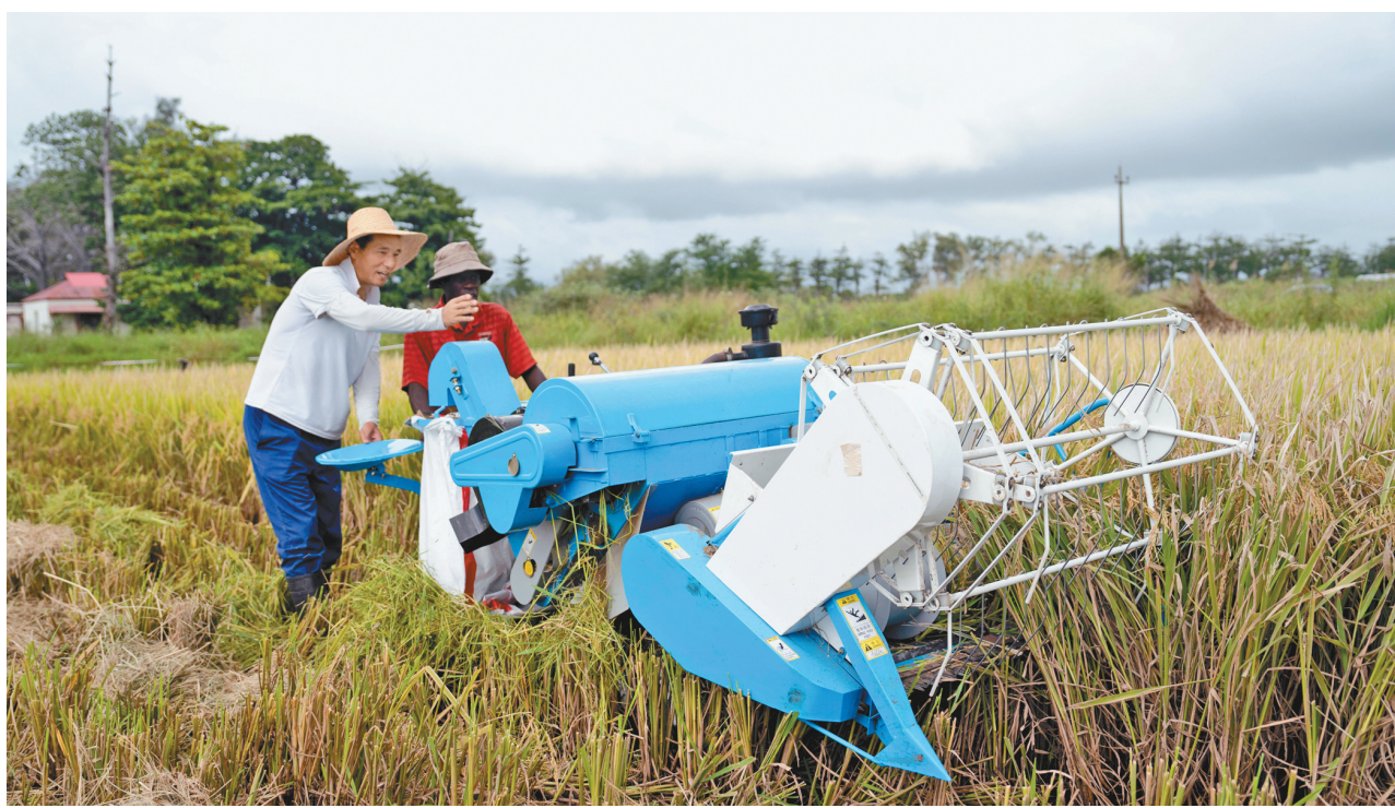
图为3月19日,在莫桑比克马普托省,中国援莫桑比克第四期高级农业专家组水稻兼农产品加工专家与当地技术员一起收割水稻。