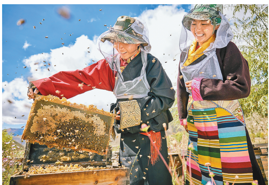
图为蜂农在取蜜(资料图片)。