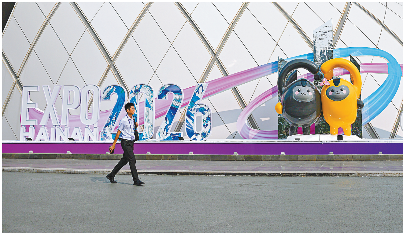
图为4月11日拍摄的第六届消博会主会场——海南国际会展中心外景。