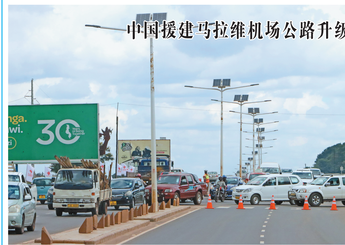
图为4月10日在马拉维首都利隆圭拍摄的马拉维首都机场M1公路。