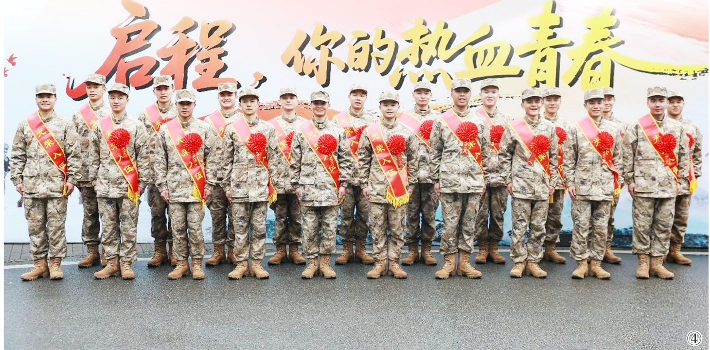
图①:新兵踏入军营的第一餐。 图②:新兵通过视频给家人报平安。 图③:新训骨干与新兵开展谈心交心。 图④:新兵合影。