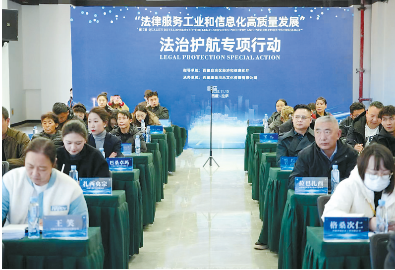
图为“法律服务工业和信息化高质量发展”法治护航专项活动现场。

自治区经济和信息化厅相关负责人表示,活动旨在精准对接企业法律需求,破解发展难题。下一步,该厅将持续聚焦企业痛点难点,推出更多精准专业服务举措,为全区经济高质量发展提供坚实法治保障。