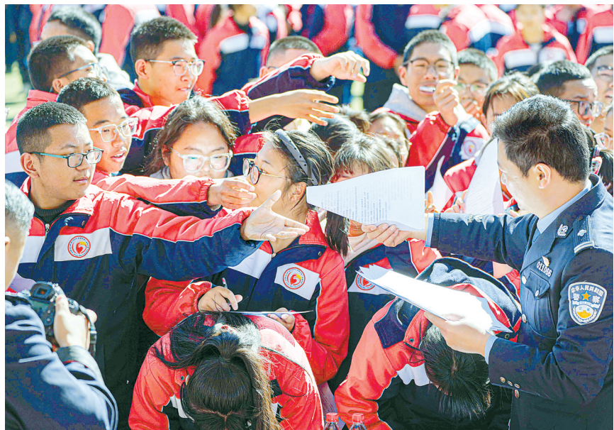
图为我区“开学第一课”网络普法进校园活动中,民警为学生发放普法宣传知识手册(资料图片)。

2025年11月1日,《中华人民共和国法治宣传教育法》正式颁布实施,该法将“青少年法治宣传教育”作为专章规定,明确要求普及青少年在家庭、学校、社会中所必需的法律知识,培育其守法意识、规则意识和防范能力。一直以来,我区高度重视青少年法治宣传教育工作,通过部门联动、搭建桥梁、创新形式等方式,逐步构建起青少年法治教育新格局,以法治力量护航青少年健康成长。