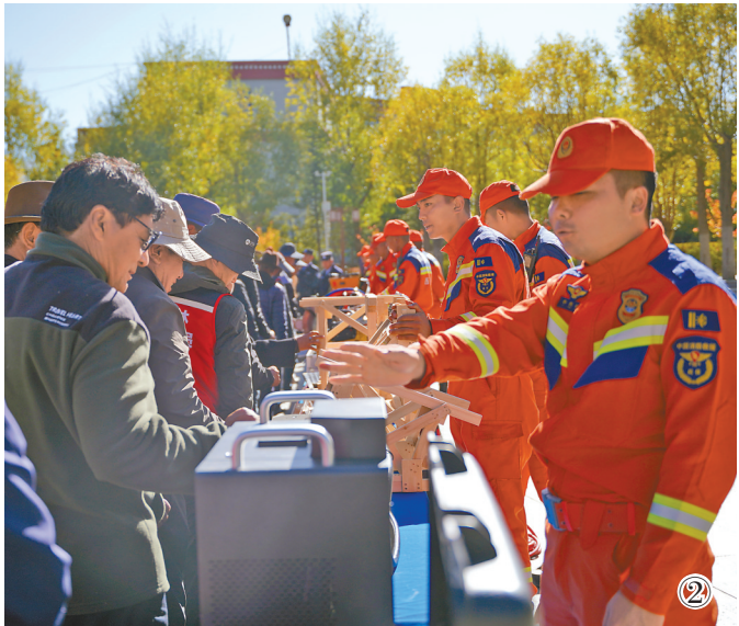
图①:群众现场体验消防设备。 图②:宣传员为群众讲解各类装备的用途与操作原理。 图③:宣传员现场展示各类装备的操作方法。