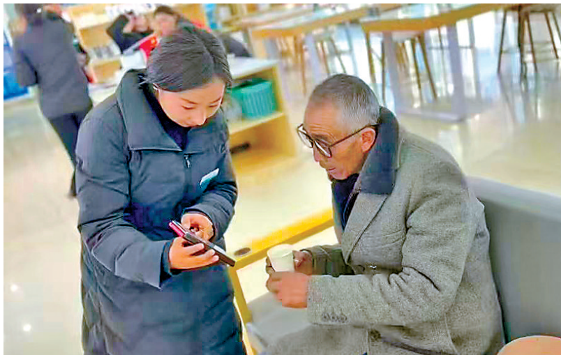
图为中国移动西藏公司工作人员向客户介绍如何查询消费账单。

第三项是账单查询再升级:全新上线的账单查询功能,优化了结构和展示界面,费用与优惠对应关系清晰。每月5日短信主动推送总额,APP、热线、营业厅随时可查。