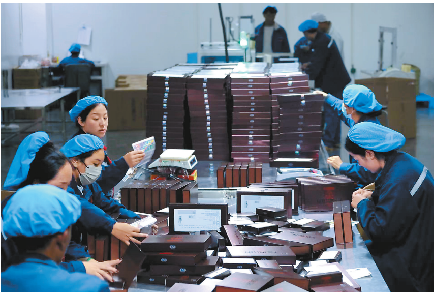
图为在西藏昌都光宇利民药业有限责任公司生产车间里,工人们在包装药品。