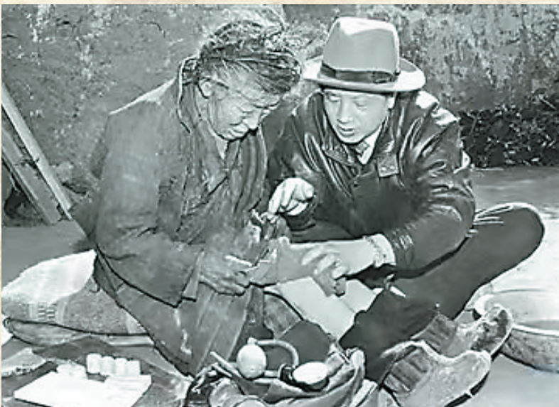
图为孔繁森(右)在阿里地区日土县看望孤寡老人。