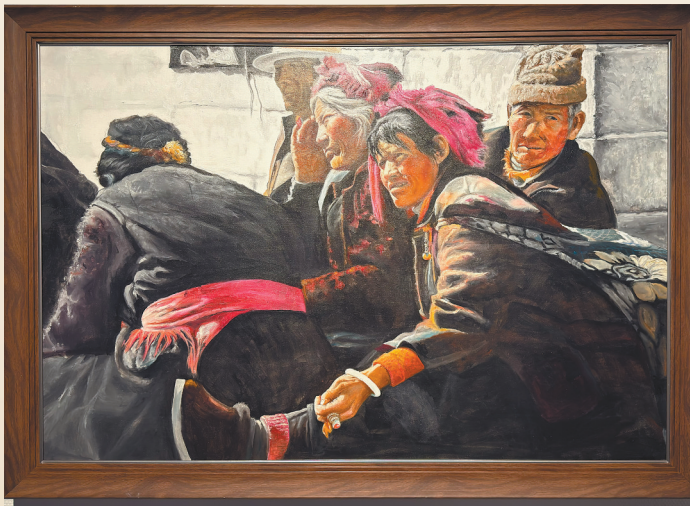
图为巴珠油画作品《歌脚》。

“雪域情”系列画展已成为西藏重要的文化品牌。本届展览以其深度的思想、精湛的艺术和真诚的情感,为西藏自治区成立60周年献上了一份独特的文化厚礼。它不仅仅是一次艺术的巡礼,更是一次精神的凝聚,通过油画的斑斓色彩,向世界讲述了一个真实、立体、全面的社会主义新西藏故事。