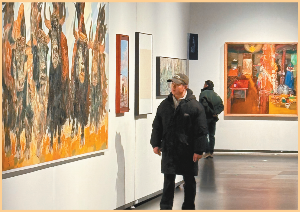
图为参观者在油画前驻足观赏。