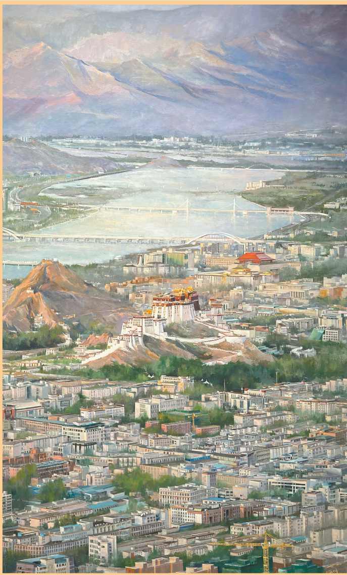
图为全海明油画作品《海拔3650》(局部)。