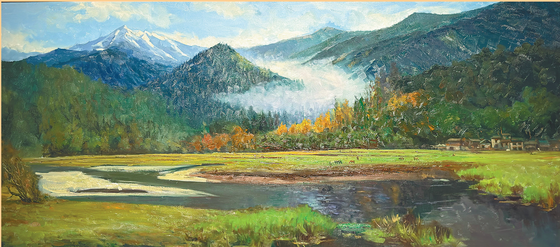
图为格桑次仁油画作品《绿水青山》(局部)。