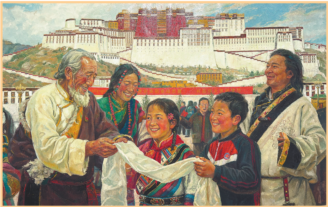
图为格热才布旦油画作品《初心接棒时》。