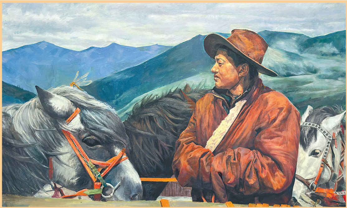
图为刘奕初油画作品《长天卷风万里晴》。