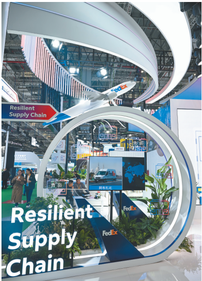
图为11月9日,人们在第八届进博会服务贸易展区联邦快递(FedEx)展台交流。