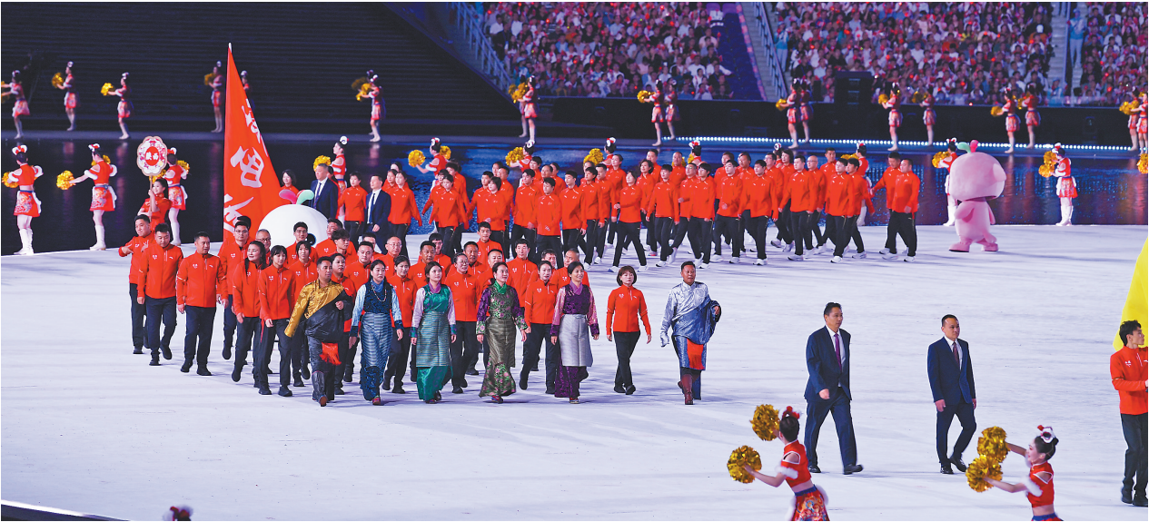
图为第十五届全运会开幕式现场,西藏自治区代表团方队亮相。

全运会圣火熊熊燃烧,开幕式在主题曲《天海一心》掀起的热烈气氛中圆满结束。在接下来的十余天,来自全国各地的优秀健儿将在广州、深圳、香港、澳门等地的多个比赛场馆展开国内最高水平的体育竞技,预祝西藏自治区运动员在本届全运会取得优异的成绩。