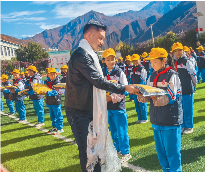
日前,山南市加查县拉绥乡联合中亿孕婴安康店与江苏依和服饰有限公司向拉绥乡小学、拉绥乡藏米点小学捐赠价值4万余元的助学物资,涵盖学习用品、日常保暖用品等方面,为当地孩子们送去温暖与关怀。