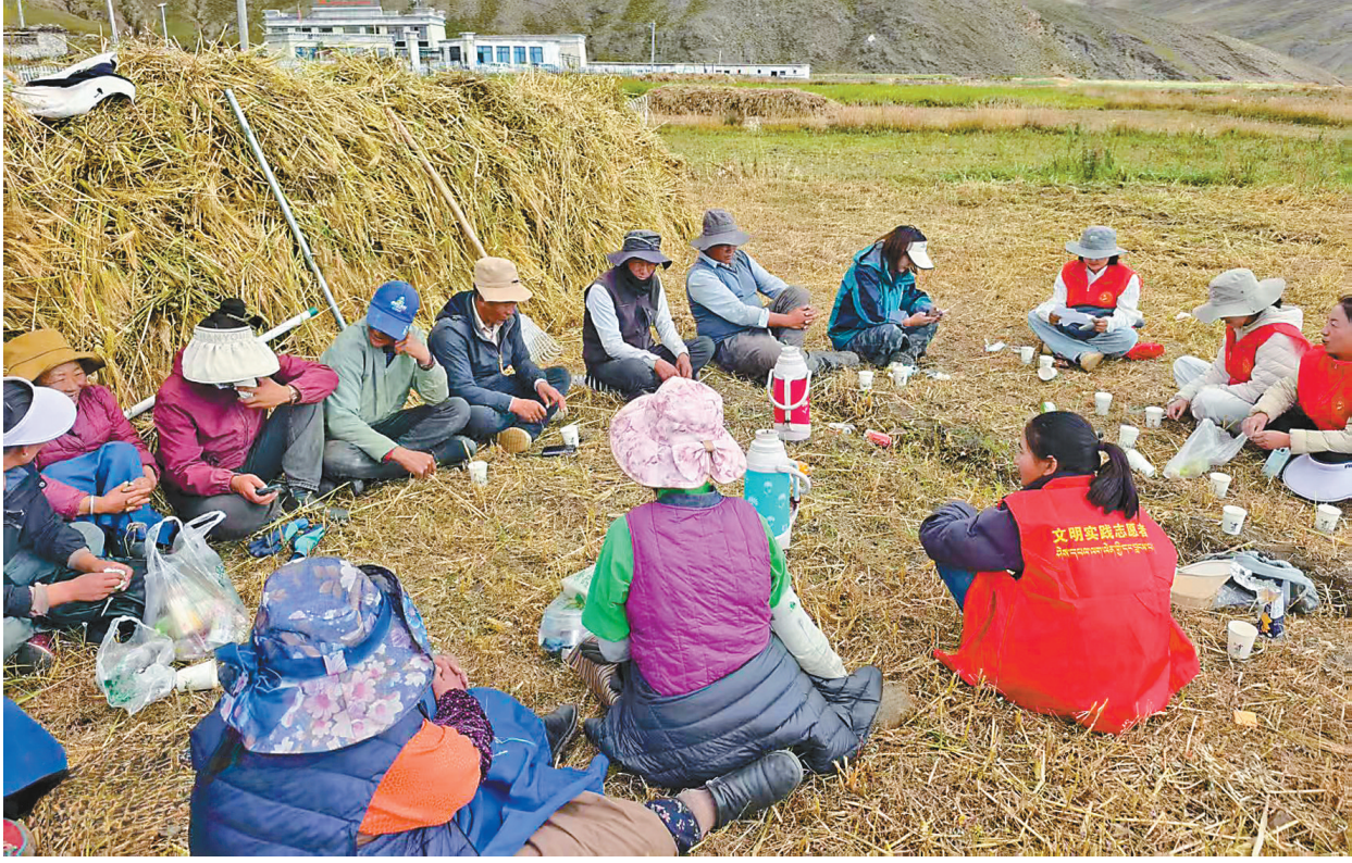
图为田间小憩，志愿者们向群众宣讲安全常识，普及新时代文明实践新风。

如今，秋收已经结束，但“红马甲”的服务从未停歇。党建引领下，志愿力量保障了粮食颗粒归仓，让文明新风在羊湖边深深扎根。