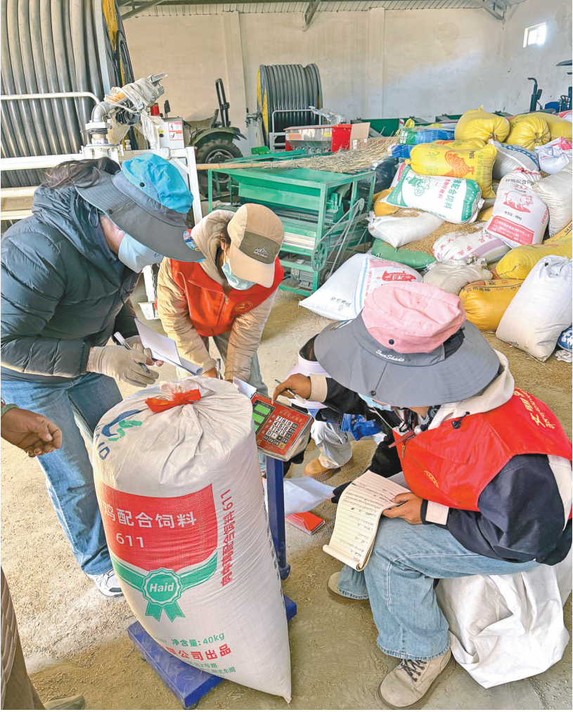
图为新时代文明志愿者正在给群众新收的粮食称重。