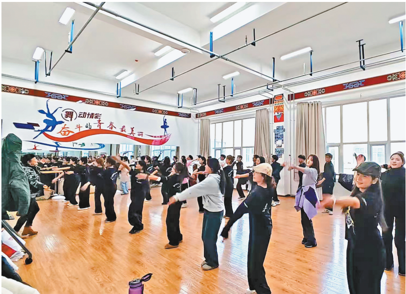
西藏民族大学民族歌舞社团的成员在一起排练锅庄舞。