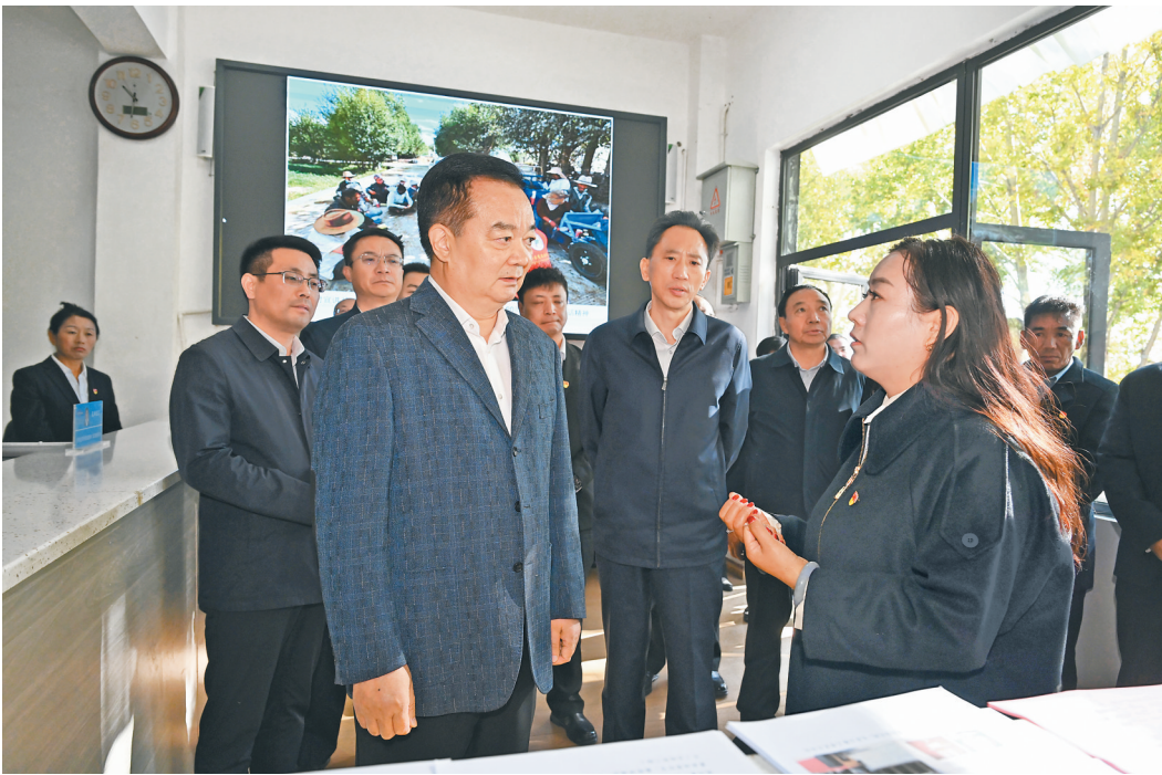
自治区党委书记王君正在曲水县达嘎镇达嘎村详细了解党员队伍结构、基层党组织建设情况。

本报拉萨10月11日讯(记者 张黎黎 张尚华)10月11日,自治区党委书记王君正前往拉萨市曲水县,宣讲习近平总书记视察西藏时的重要讲话精神并调研基层党建工作。他强调,要深入贯彻习近平总书记关于党的建设的重要思想、关于西藏工作的重要指示和新时代党的治藏方略,认真落实习近平总书记视察西藏时的重要讲话精神,加强党的建设,充分发挥基层党组织战斗堡垒作用,不断打牢党在西藏的执政基础,为社会主义现代化新西藏建设提供坚强组织保障。 王君正高度重视软弱涣散基层党组织整顿提升工作。达嘎镇达嘎村2024年被评为软弱涣散基层党组织,今年以来达嘎村面貌发生了积极变化。王君正来到这里详细了解党员队伍结构、基层党组织建设、基层治理及党组织软弱涣散形成原因,同大家一起研究解决办法。他说,基础不牢、地动山摇,党的基层组织是党的全部工作和战斗力的基础,要增强党组织政治功能和组织力凝聚力,强化年轻党员干部培养,把服务群众、造福群众作为出发点和落脚点,真正把基层党组织建设成为有效实现党的领导的坚强战斗堡垒。基层干部直接面对群众、服务群众,是党的路线方针政策落实的“最后一公里”,要切实关心群众、心里装着群众,深入基层一线了解群众所思所想所需,站在群众立场思考问题、带着感情帮助群众解决问题,有针对性地采取措施,真心实意为群众做好事、办实事、解难事,树立起党委、政府的良好形象。 金秋十月,高原山村层林尽染。王君正前往曲水镇俊巴渔村、西藏金哈达药业有限公司,进村舍、入厂房,认真了解基层党建引领乡村振兴等情况。他指出,乡村的美丽不仅仅体现在山清水秀,更体现于文化的特色。要认真梳理、深度挖掘城乡一体的文旅融合发展模式,突出重点、以点带面,积极培育乡村旅游、休闲农业等新产业新业态,牢牢守住生态和安全底线,切实把资源优势转化为发展优势。藏医药是中医药的重要组成部分,要传承精华、守正创新,提高科研创新能力,推进藏医药现代化、产业化、市场化,让更多特色产品走出高原、卖上好价钱,助力农牧民增收致富。 调研中,王君正强调,全区各级党委(党组)要扎实推进新时代党的建设新的伟大工程,坚决扛起全面从