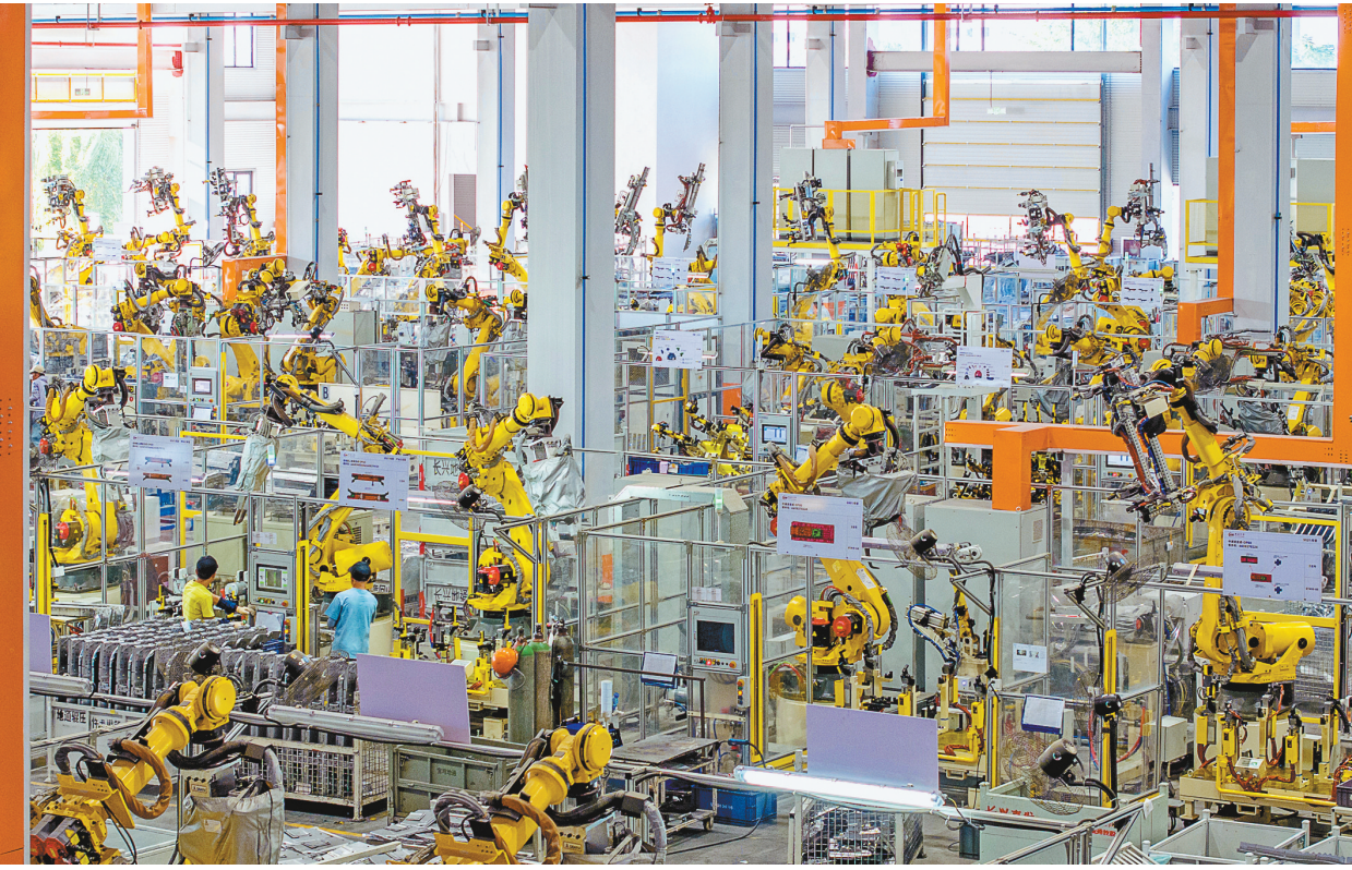
上图:10月9日,浙江省湖州市长兴经济技术开发区的长兴地通汽车部件有限公司技术人员操控工业机器人生产新能源汽车配件(无人机照片)。