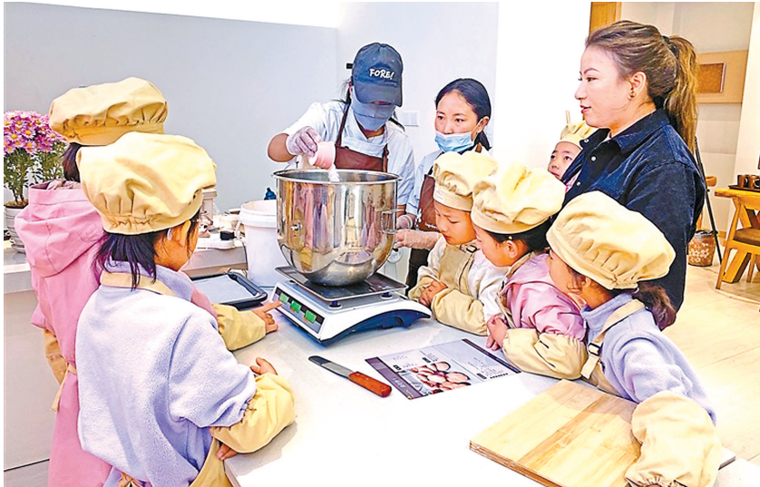
▲纳金村新时代文明实践站组织青少年开展“甜蜜烘焙 童趣飞扬”主题活动。