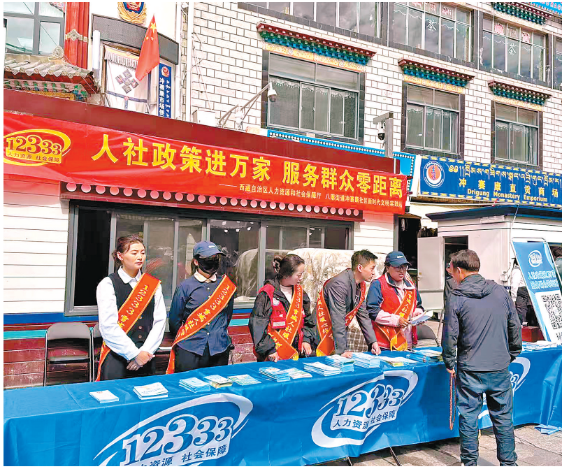
近日,八廓街道冲赛康社区联合驻村工作队、“双报到双积分”党员志愿者及人社部门工作人员,在冲赛康广场开展人社政策专题宣讲活动。活动现场搭建起宣传咨询台,摆放着养老保险、医疗保险等宣传资料,社区工作人员与居民面对面交流,一对一答疑解惑,帮助居民理解政策要点。图为人社政策专题宣讲活动现场。

当雄县相关负责人表示,下一步,将持续聚焦未成年人保护,计划2个月内,在全县10所中小学开展防性侵、防校园欺凌、心理健康疏导等宣讲。同时联合乡镇(社区),在村民小组、文化活动中心同步开展“家长专场”宣讲,通过“学生+家长”双向覆盖,搭建“学校—家庭—社会”三位一体关爱网络,延伸未成年人保护力量。