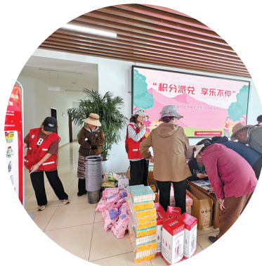
▲在纳金社区开展志愿积分兑换活动现场,居民纷纷用自己的积分兑换生活用品。

打造”的有力举措,切实激活了基层治理的“红色动能”,初步形成了党组织有力引领、党员示范带头、群众广泛参与、资源有效整合的共建共治共享新格局。