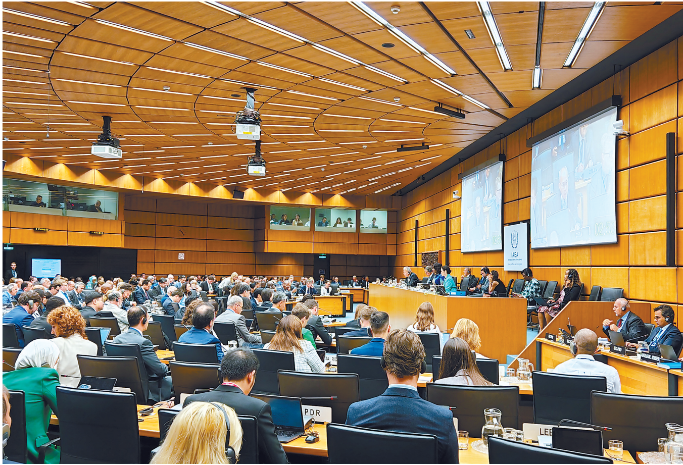
图为9月10日在奥地利维也纳拍摄的国际原子能机构理事会会议现场。

据新华社约翰内斯堡电(记者 白舸 蒋国鹏)南非互联网媒体“外交界”日前发表专题文章说,全球治理倡议是对推动当前全球治理体系变革的重要贡献,为构建更加公正合理的国际秩序提供了中国方案。文章摘要如下: 今年是世界反法西斯战争胜利和联合国成立80周年,全球治理倡议的提出具有深刻历史背景,不仅体现了对多边主义的坚守,更对当前全球治理机制存在的制度性缺陷作出积极回应。 该倡议与中国先前提出的三大全球倡议相互衔接、彼此支撑,为完善全球治理、塑造更加公正均衡的国际秩序注入重要动力。 全球治理倡议诞生于世界多极化深入发展的背景下。随着亚洲、非洲和拉丁美洲国家在国际事务中寻求更大话语权,全球治理体系需要朝着更加民主化的方向演进。上合组织天津峰会充分展现了多极化世界的活力。与冷战时期的意识形态对抗不同,上海合作组织始终坚持安全、发展、文化等多领域的务实合作,体现了新型国际关系的核心要义。 在当今治理赤字凸显、国际秩序深刻变革的关键时期,全球治理倡议并非要挑战现行国际秩序,而是助力其向更加包容、法制化、以人为本的方向变革。