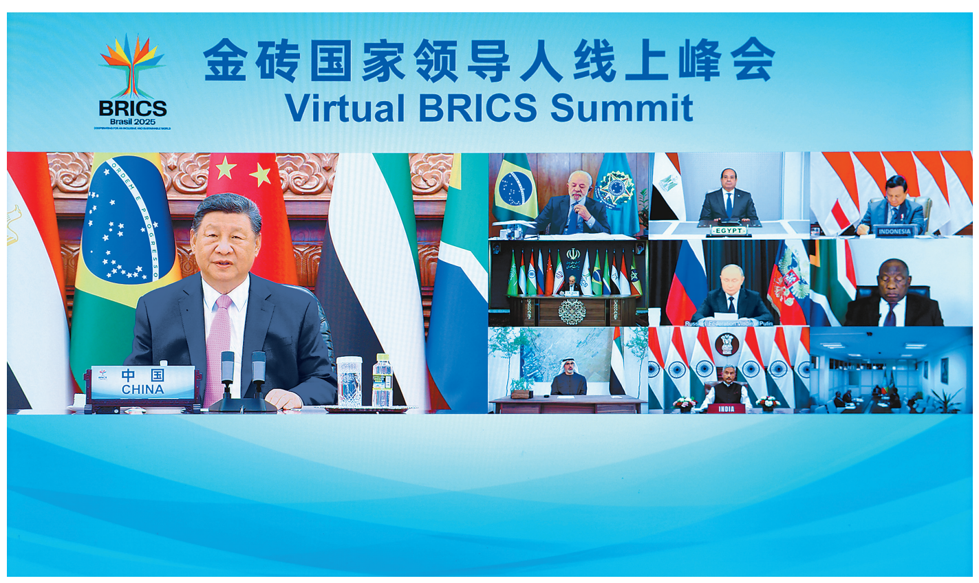
9月8日晚，国家主席习近平出席金砖国家领导人线上峰会，并发表题为《团结合作 砥砺前行》的重要讲话。