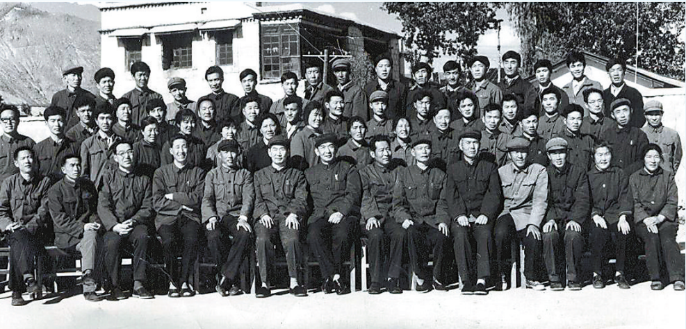
1973年7月,西藏自治区高级人民法院恢复组建时,领导与全体干警合影。

60年来,在区委坚强领导、人大及其常委会有力监督、最高人民法院正确指导和政府、政协及社会各界大力支持下,区高法院带领全区各级法院一手抓反对分裂、打击犯罪,一手抓化解矛盾、促进和谐,紧紧围绕“让人民群众在每一个司法案件中感受到公平正义”的目标,积极推进各项工作,取得了令人瞩目的成绩。