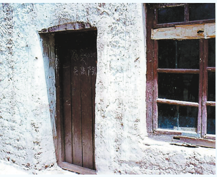
西藏法院成立初期,基层法院办公用房。

经过60年发展变迁,西藏法院紧紧抓住中央关心、全国支援的战略机遇,大力加强自身建设,推动西藏司法审判事业在艰难中起步、在希望中奋进、在拼搏中发展,取得了非凡的发展成就。截至目前,西藏共有1个高级人民法院、7个中级人民法院、74个基层人民法院、152个人民法庭。全区法院干警数量从1965年区高法院成立时的103名,增加到近3000名,另有聘用制书记员、聘用制司法警务辅助人员等近1200名;人员类别从传统的法官、书记员、行政人员,细化为法官、司法辅助人员(法官助理、书记员、司法警察等)、司法行政人员。