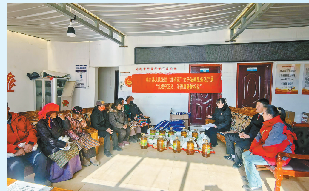
2025年2月,噶尔县人民法院“红柳花”女子法律服务站赴昆莎乡索麦村开展法治宣讲。

如今,运用“一张网”不同模块功能,智能辅助证据审查、类案推送、法条检索、文书自动生成、量刑建议分析等,法官事务性负担得到减轻,裁判精准度大幅度提升。运用大数据分析案件运行态势,法官工作负荷、审判质效指标,实现科学分案、动态预警、精准管理。执行联动智能化,深化“总对总”“点对点”网络查控系统,有效整合多部门数据,精准查控财产。