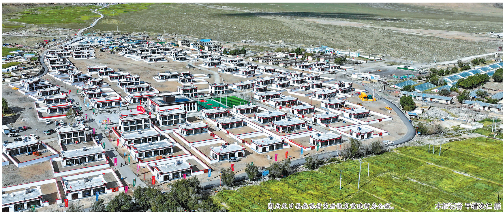
图为定日县森嘎村灾后恢复重建新房全貌。