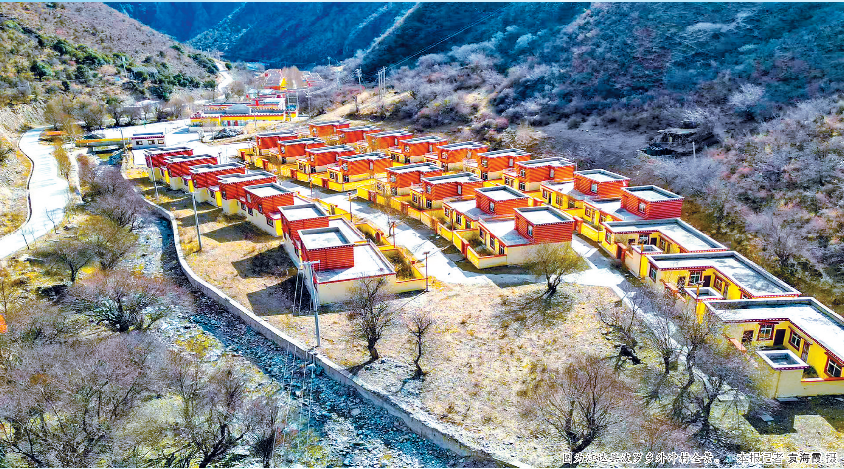
图为江达县波罗乡外冲村全景。