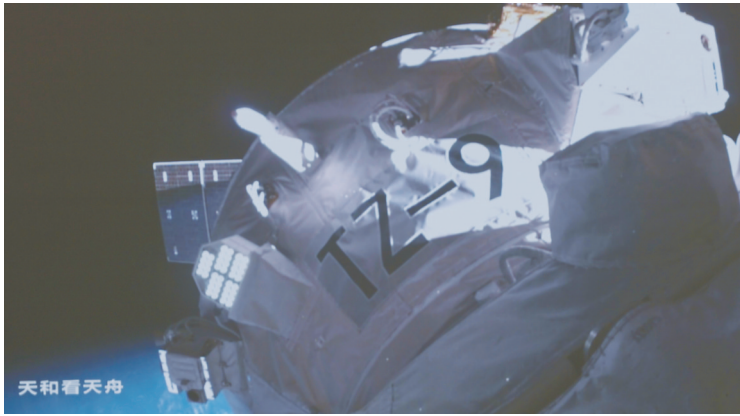
图为7月15日在北京航天飞行控制中心拍摄的天舟九号货运飞船与空间站组合体完成交会对接的画面。