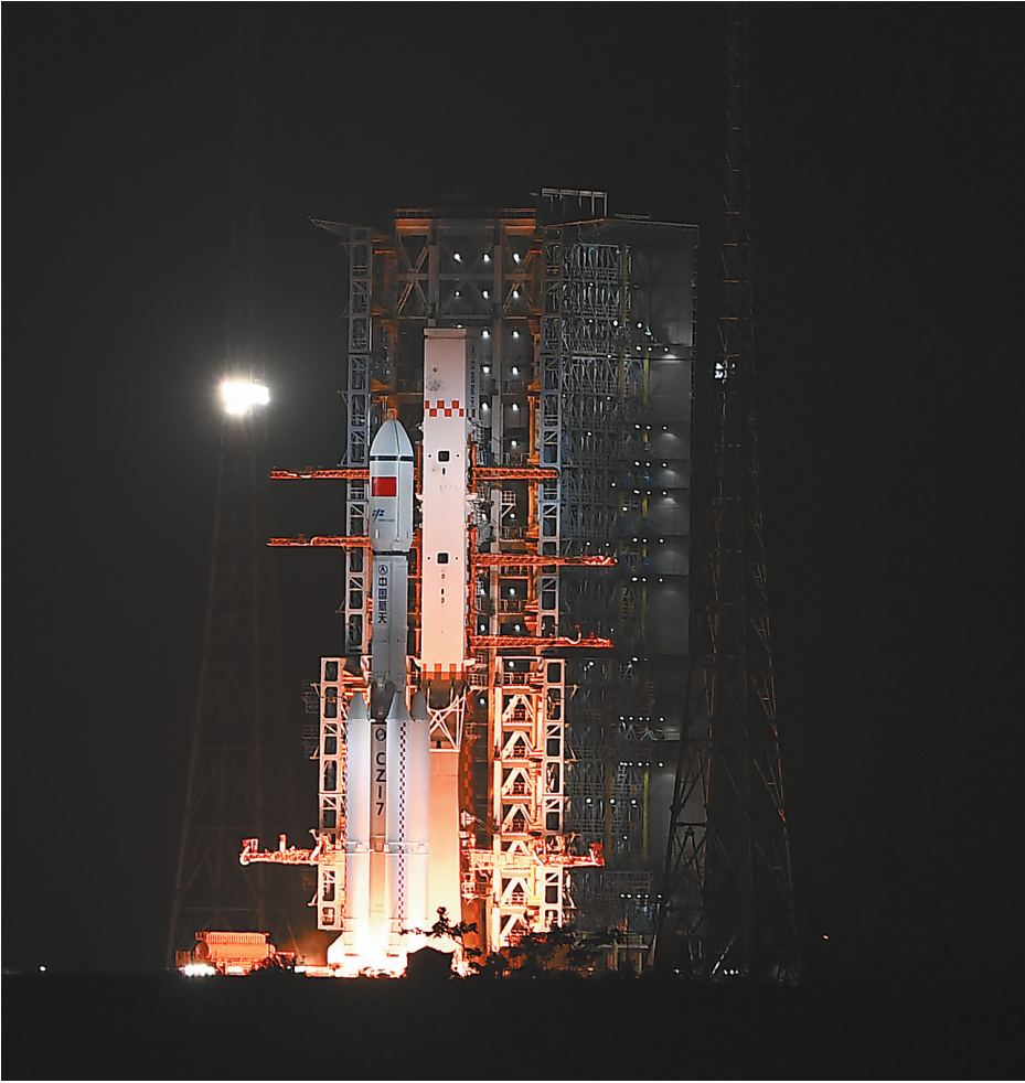
图为7月15日5时34分，搭载天舟九号货运飞船的长征七号遥十运载火箭，在我国文昌航天发射场点火发射，约10分钟后，天舟九号货运飞船与火箭成功分离并进入预定轨道，之后飞船太阳能帆板顺利展开，发射取得圆满成功。

后续，神舟二十号航天员乘组将进入天舟九号货运飞船，按计划开展货物转运等相关工作。