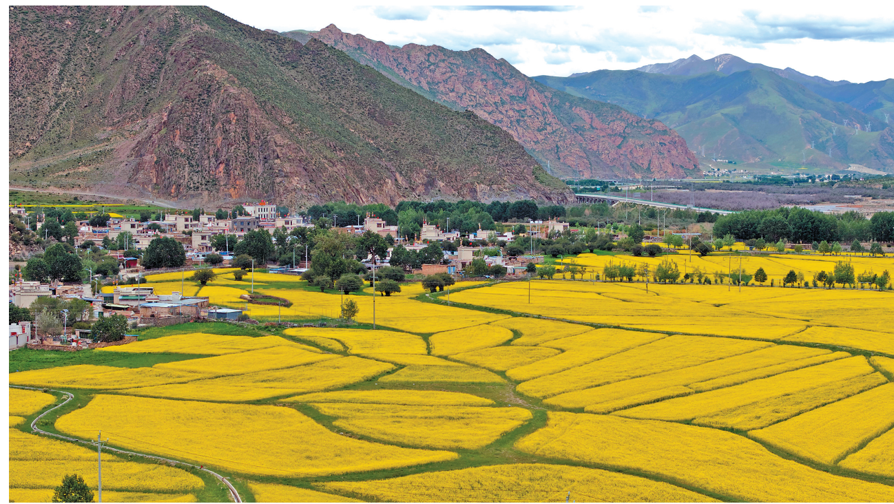
盛夏时节,拉萨市墨竹工卡县的万亩油菜花迎来盛花期,金黄色的花海与高原特有的蓝天白云相映成趣,构成一幅壮美的自然画卷。近年来,墨竹工卡县适度扩大油菜种植规模、举办油菜花旅游推介会等,大力发展小莱籽油特色产业,推动产业发展和群众增收致富。 图为墨竹工卡县的油菜花田。