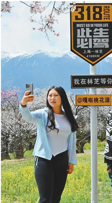
▲游客在嘎拉村打卡留念。