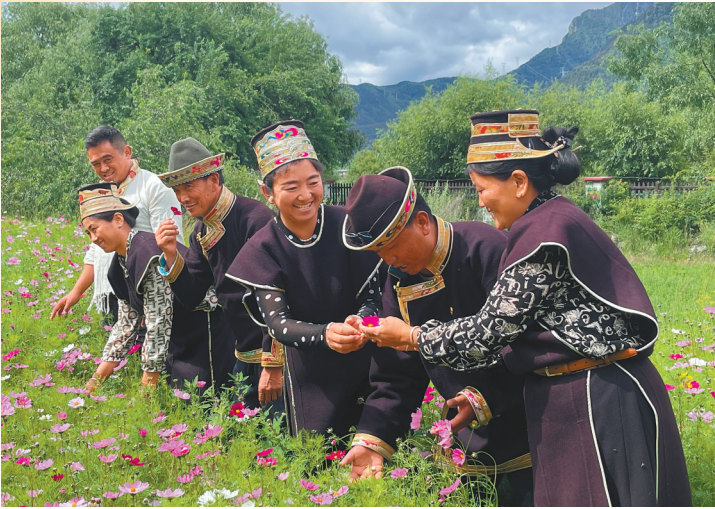
▲嘎拉村村民在赏花。