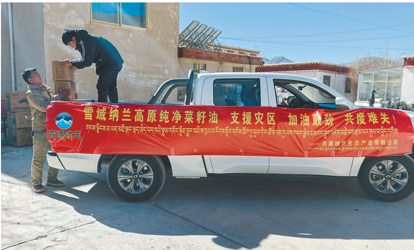
今年1月,西藏纳兰生态产业有限公司运送菜籽油支援定日县地震灾区。