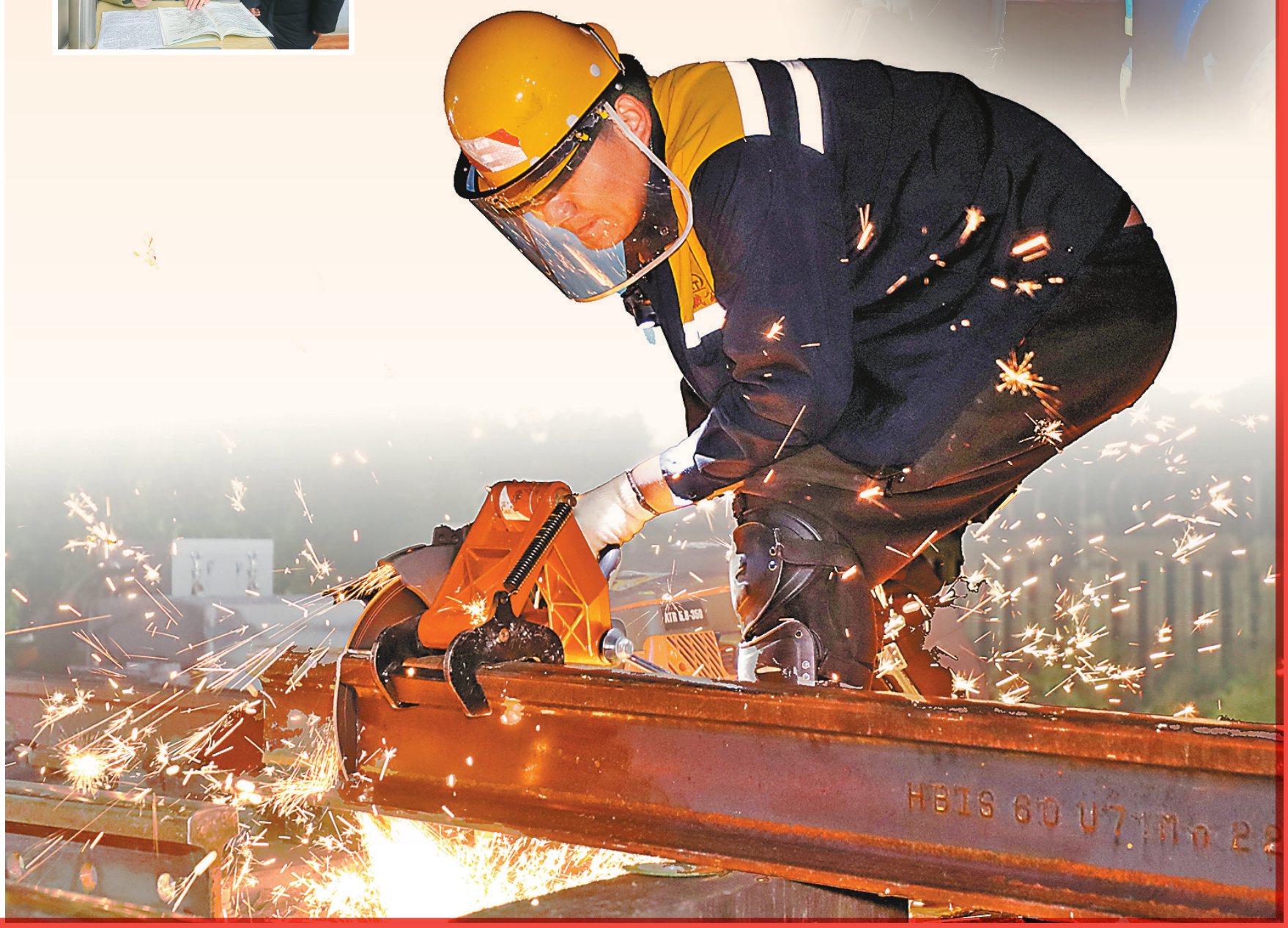
图⑩:中国铁路青藏集团有限公司拉萨基础设施段的施工作业人员在开展当古站岔区无缝化改造施工。