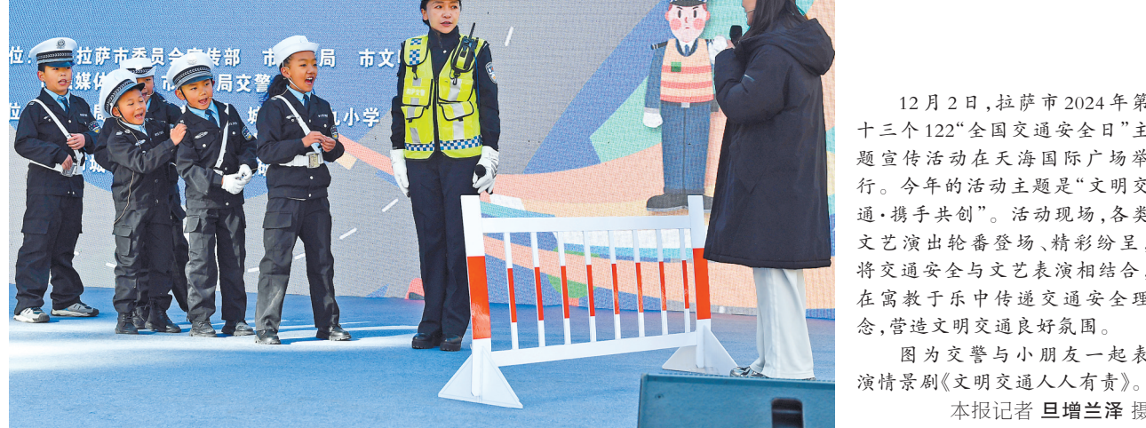
十二月二日，拉萨市2024年第十三个122“全国交通安全日”主题宣传活动在天海国际广场举行。今年的活动主题是“文明交通·携手共创”。活动现场，各类文艺演出轮番登场，精彩纷呈，将交通安全与文艺表演相结合，在寓教于乐中传递交通安全理念，营造文明交通良好氛围。 图为交警与小朋友一起表演情景剧《文明交通人人有责》。