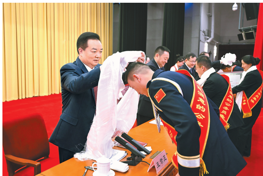
11月18日下午,第二届自治区“人民满意的公务员”和“人民满意的公务员集体”表彰大会在拉萨举行。这是王君正等自治区领导向受表彰代表颁奖。