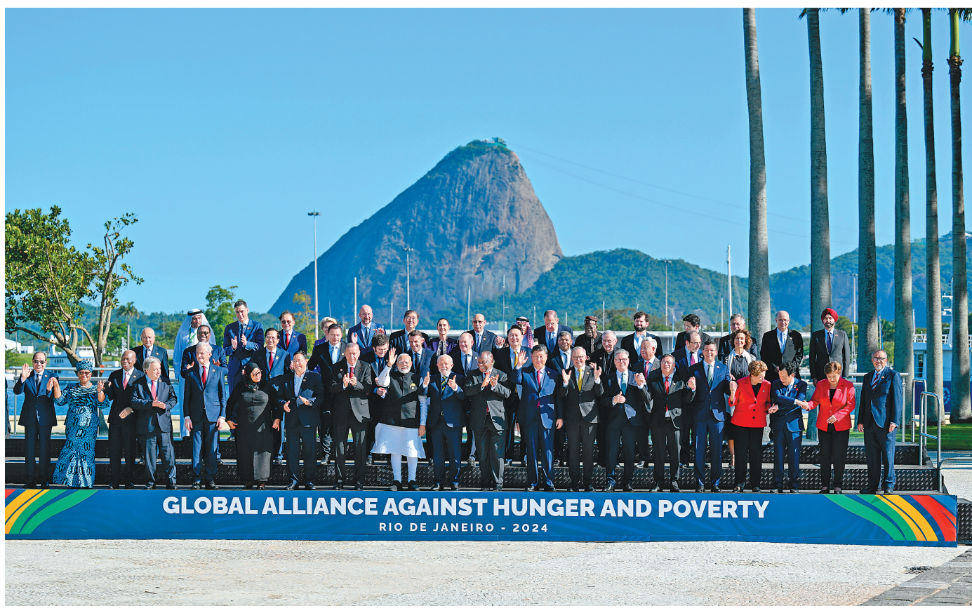
GLOBAL ALLIANCE AGAINST HUNGER AND POVERTY RIO DE JANEIRO - 2024