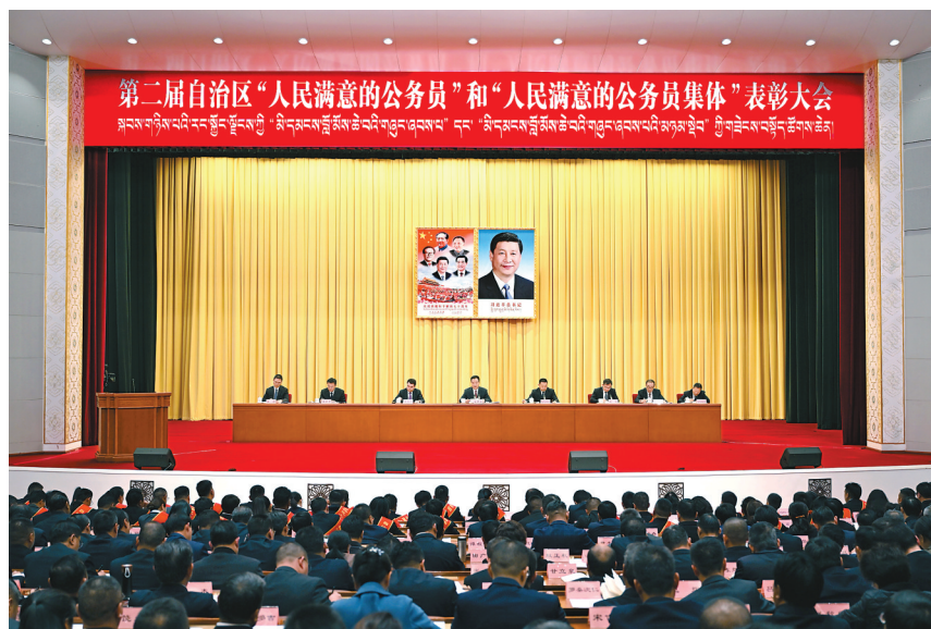
11月18日下午,第二届自治区“人民满意的公务员”和“人民满意的公务员集体”表彰大会在拉萨举行。这是表彰大会现场。

本报拉萨11月19日讯(记者 刘文涛 张黎黎)18日下午,第二届自治区“人民满意的公务员”和“人民满意的公务员集体”表彰大会在拉萨举行。自治区党